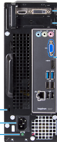
Zásuvky pre rozširujúce karty